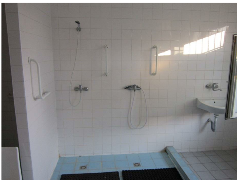
Obrázek 7 – sprchy bez závěsů