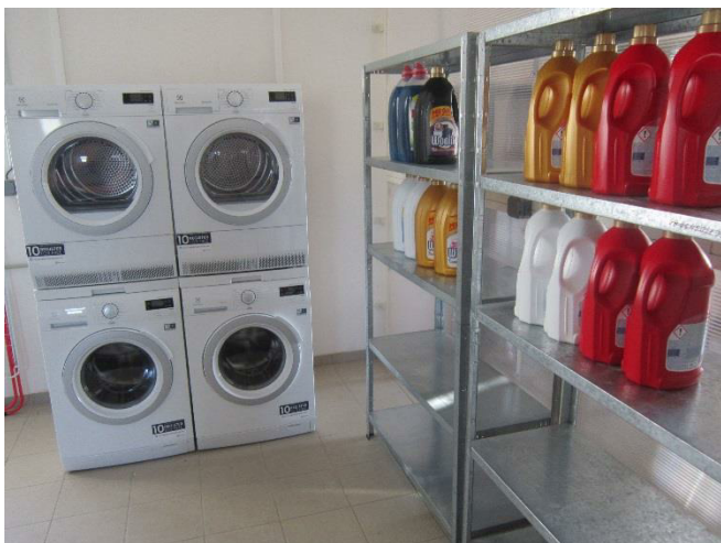
Obrázek 2 – připravené pracoviště prádelny

Uvedenou snahu o pracovní zařazení chovanců oceňuji. Podle možností doporučuji umožnit pracovní zařazení co nejvíce chovancům.