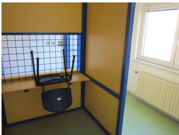
Obrázek 9 – návštěvní místnost s přepážkou

Doporučuji proto zvážit, zda je přítomnost dozorce při návštěvě nutná i v případech, kdy to nebude návštěvník žádat a u konkrétního chovance nebude důvodná obava z napadení návštěvníka popř. vnášení nepovolených věcí, a zda by nepostačil pouze dohled např. prostřednictvím kamery nebo přes průzor ve dveřích, tedy mimo doslech.