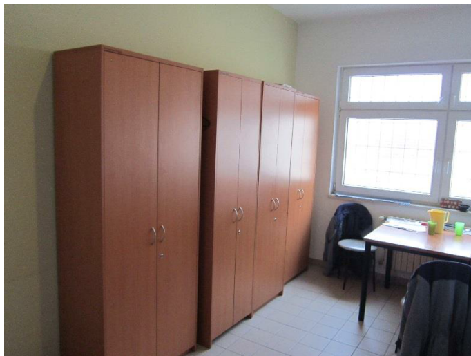
Obrázek 4 – prostor k uložení věcí v cele