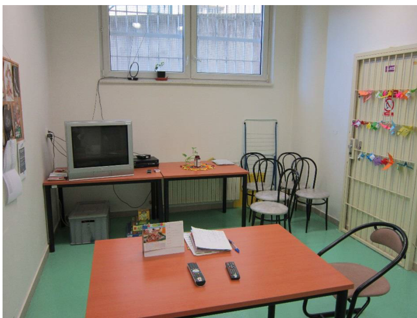
Obrázek 5 – jedna z „kulturek“