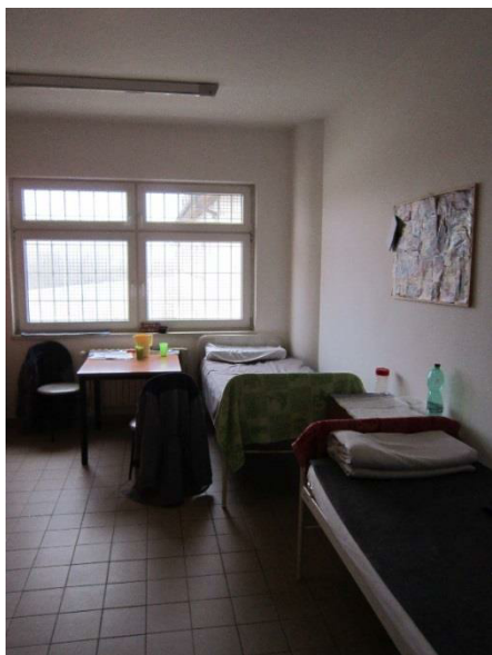
Obrázek 3 – vybavení cely