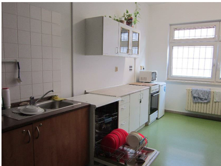
Obrázek 8 – kuchyňka a plastové talíře

Pitný režim je zajištěn nápoji (zpravidla čaj), které personál vydává při výdeji stravy. A dále pak mají chovanci neomezeně k dispozici vodu na celách. Odsouzeným také v případě zájmu zalévá personál třikrát denně kávu při výdeji stravy. 27