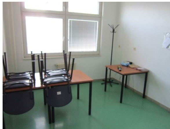
Obrázek 10 – návštěvní místnost restauračním způsobem