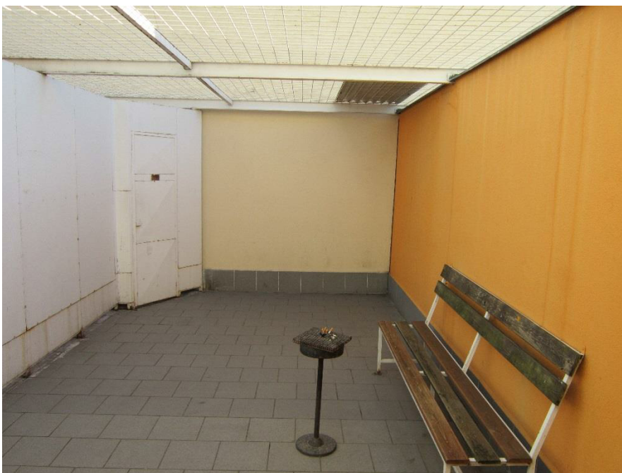
Obrázek 6 – malé vycházkové dvorky