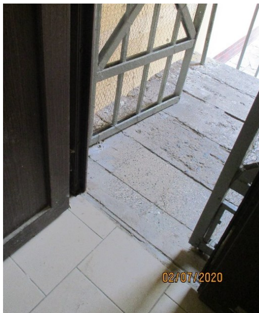
Foto č. 8 a 9 Přístup na vycházkový dvůr