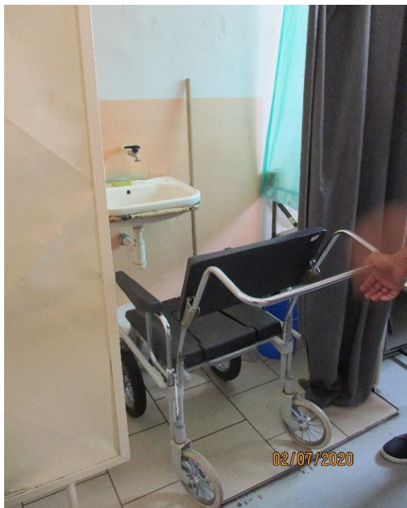
Foto č. 7 Způsob oddělení sanitárního zařízení od zbytku cely

Podmínky výkonu trestu v souvislosti s hygienou a stravováním považují za nedůstojné, a to zejména z důvodu neposkytnutí vhodných kompenzačních pomůcek – standardní invalidní vozík, který by umožnil samostatný pohyb, a sklopný stolek usnadňující konzumaci jídla. Oddělení sanitárního zařízení považují za nevyhovující, stejně jako zařízení určené ke sprchování osob s tělesným postižením.