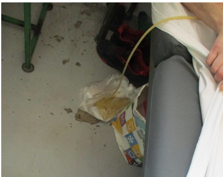
Foto č. 2 Umístění drenážního systému permanentní močové cévky

Co se týče péče o permanentní močovou cévku, ze zdravotní dokumentace pana A. bylo zjištěno, že je měněna v pravidelných intervalech (jednou za měsíc). Za naprosto nevhodné však považuji umístění cévky na zemi vedle postele stěžovatele z důvodu rizika zanesení infekce. 13 Zdravotnické zařízení by mělo panu A. neprodleně poskytnout háček či jiný prostředek k zavěšení drenážního systému.