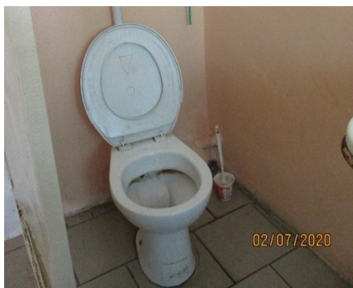
Foto č. 5 a 6 Přístup na toaletu