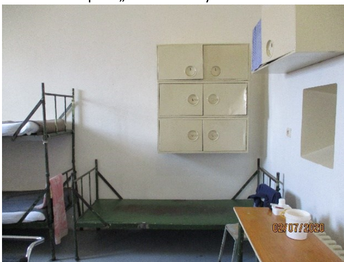
Foto č. 4 Umístění uzamykatelných skříněk pro odsouzené na „eskortní“ cele

Rovněž signalizační zařízení u dveří cely je pro odsouzeného s tělesným postižením zcela nedostačující. Za absurdní považuji, že by vězněná osoba s tělesným postižením byla v případě, že by došlo k náhlé nevolnosti nebo ohrožení života, nucena v takovém stavu vstát z lůžka a dostat se ke dveřím cely, kde může spustit signalizační zařízení. Navíc, pan A. ani nemá k dispozici vhodný invalidní vozík, a k tomu, aby použil signalizační zařízení, potřebuje asistenci spoluvězňů. Reálně je tedy v jeho případě možnost použít signalizační zařízení v případě nouze závislá na přítomnosti a ochotě ostatních odsouzených.