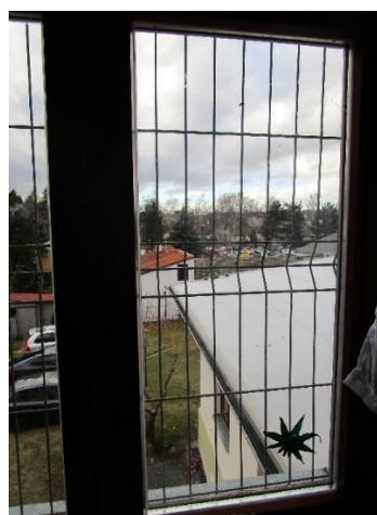
Obrázek 4: Mříže na pokoji skupiny D.