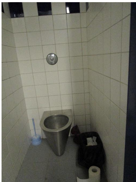
Obrázek 2: Toaleta na skupině E.

Strohost vnitřních prostor na skupině E se projevovала také na vybavení sanitárního zařízení, kde toalety nebyly opatřeny poklopem ani záchodovým prkénkem. S ohledem na respektování lidské důstojnosti, jakož i na požadavek hygienické nezávadnosti a základního komfortu, je žádoucí vybavit toaletní mísu záchodovým prkénkem s poklopem. Je technicky proveditelné, aby toto vybavení bylo zhotoveno z omyvatelných materiálů a způsobem, který bude minimalizovat jeho případné poškození nebo zničení, nebo případné použití k ohrožení dítěte či okolí.