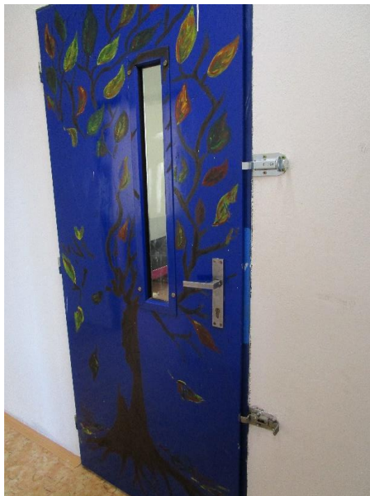
Obrázek 1: Průzory a petlice u dveří na skupině E.

Průzory by neměly být využívány plošně, ale pouze v případech, kdy je k tomu dán důvod. Vizualní kontrole by navíc mělo předcházet upozornění například zaklepaním na dveře. Jinak by měly být průzory zakryty tak, aby do pokojů nebylo vidět (např. látkovou roletou).