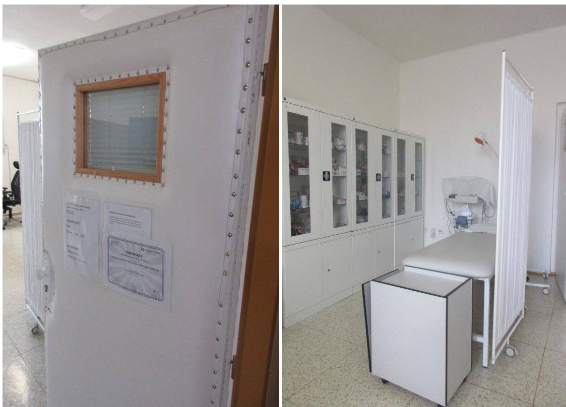
Foto č. 7 a 8: Vstup do ordinace a prostor v ordinaci za plentou, který nesnímá kamera.

Příslušnice vězeňské služby nebývá v ordinaci prakticky nikdy. Pokud však vyvstane potřeba, aby příslušnice byla v ordinaci, pak se o tom učiní záznam do zdravotnické dokumentace.