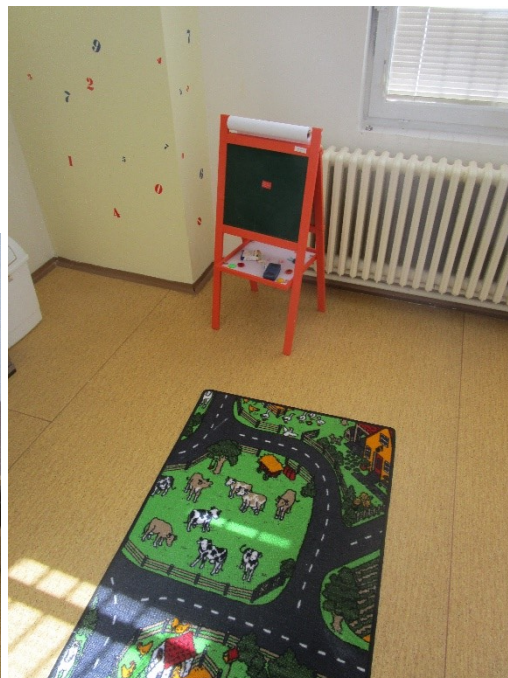
Foto č. 12 a 13: Prostory pro návštěvy bez zrakové a sluchové kontroly.

Chci ocenit úsilí, které věznice věnuje zajištění vhodných prostor pro možnosti návštěv rodin vězněných osob. Nicméně ani tyto prostory nejsou přístupné pro odsouzené s výrazným omezením pohybu (viz foto č. 6 a opatření č. 1).