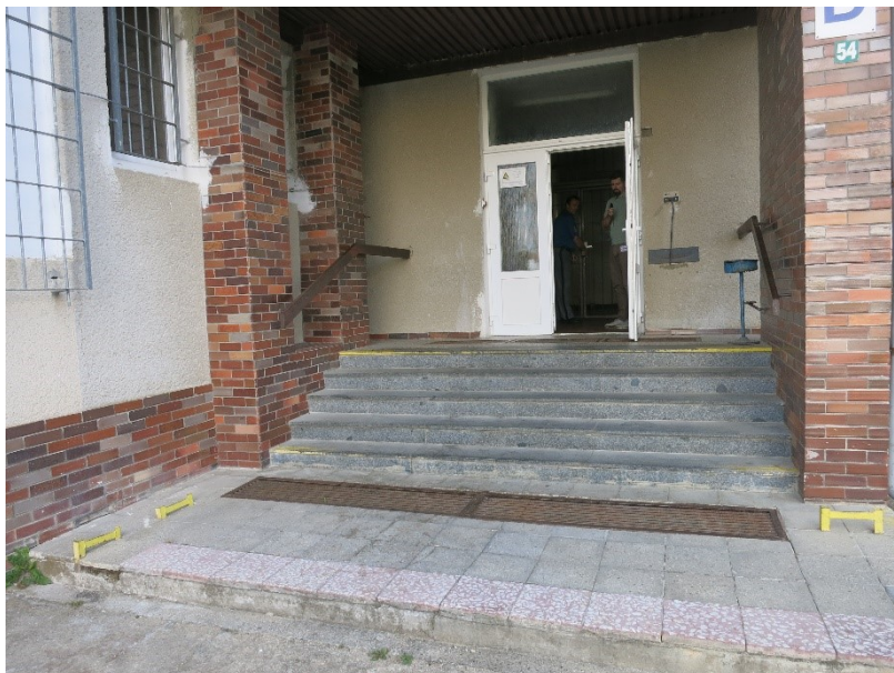
Foto č. 2: Bariérový vchod do budovy D, kde je ve 2. nadzemním podlaží oddíl TPN.