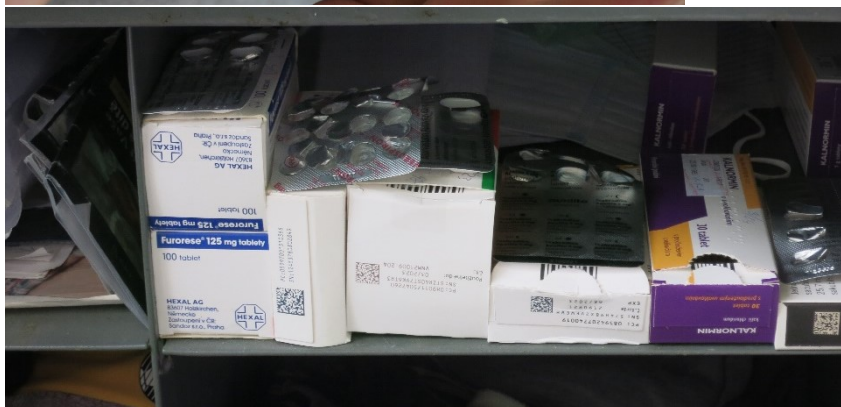
Foto č. 15 a 16: Léky, které mají odsouzení u sebe v lékovce či originálním balení.