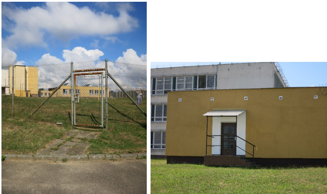
Foto č. 5 a 6: Přístup na vycházkový dvůr – bez nájezdu a schody vedoucí do místnosti pro návštěvy bez zrakové a sluchové kontroly.

Věznice není připravena na umístění odsouzených s výraznějším pohybovým omezením či se smyslovým postižením. V případě, že taková situace nastane, pak dle vedení věznice bude odsouzený přemístěn na žádost ředitelky do jiné věznice.