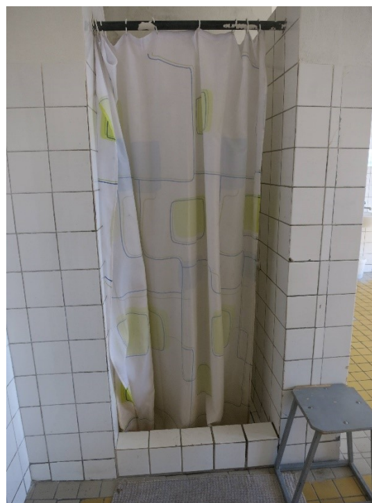
Foto č. 3 a 4: Schodiště v rámci oddílu TPN a bariérová koupelna na oddíle TPN.