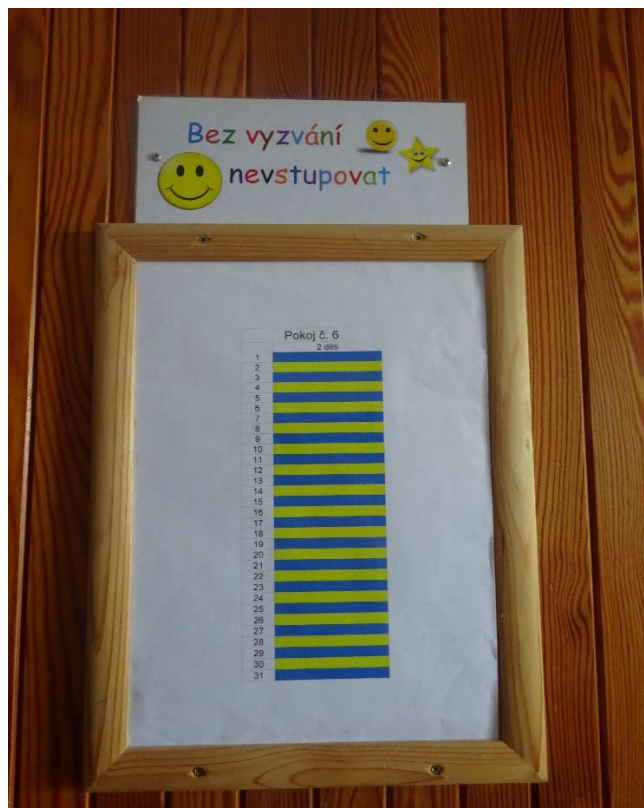
Obrázek 5 – cedulka na dveřích chlapeckého pokoje