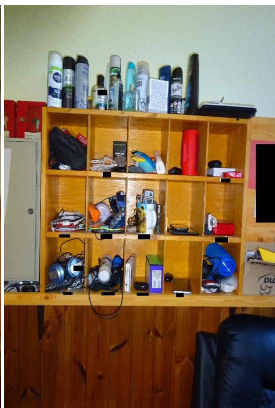
Obrázek 7 – přihrádky chlapců na vychovatelně

Rozumím tomu, že se personál zařízení snaží chlapce během jejich pobytu na oddělení chránit. Výše popsané opatření, které chlapcům brání v tom, aby si sami rozsvítili světlo