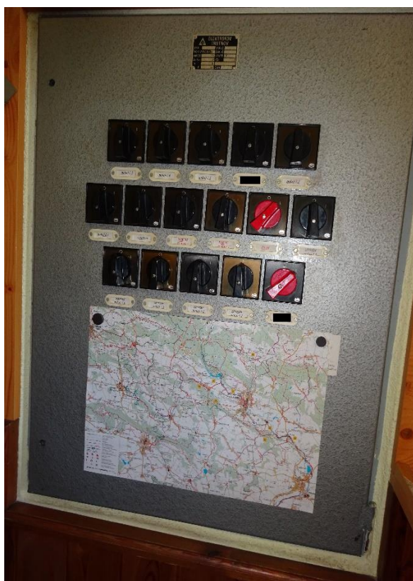
Obrázek 6 – centrální vypínače na vychovatelně

Na vychovatelně žlutého patra se nachází deska s centrálními vypínači k jednotlivým pokojům a zásuvkám v nich. Pokud si chlapci chtějí v pokoji rozsvítit nebo zapnout televizi, musejí o to požádat vychovatele, který jim jednotlivé vypínače z vychovatelny zprovozní. Podle personálu jde o bezpečnostní opatření.