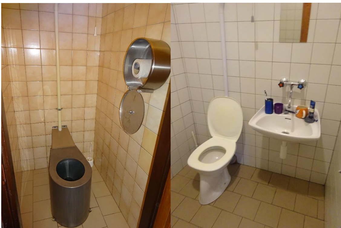
Obrázek 2 – toalety žlutého týmu