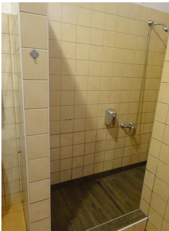
Obrázek 4 – sprchový kout bez závěsu