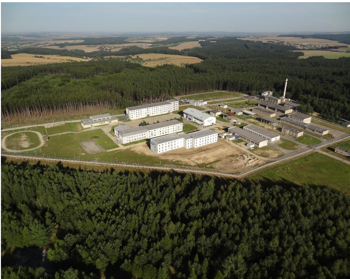
Foto č. 1: Věznice Rapotice

Odsouzení zařazení do SSZ byli umístěni ve třech oddílech (na třech patrech téže ubytovny), a to na oddíle B, C a D. Každý oddíl je rozdělen mříží na dvě stejně velké části. Oddíl B zahrnuje nástupní oddíl a výstupní oddíl (oba na B1). Součástí oddílu C je bezdrogová zóna. Oddělení pro výkon kázeňských trestů (OVKT) určené pro celou věznici a krizová cela se nachází v přízemí téže ubytovny.